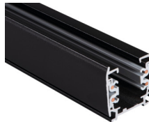
33233 TEAR N TR 2M-B

Elemento di sistema a sbarra, TEAR N TR 2M-B, sbarra colletttrice a 3 circuiti, nero, (33233)